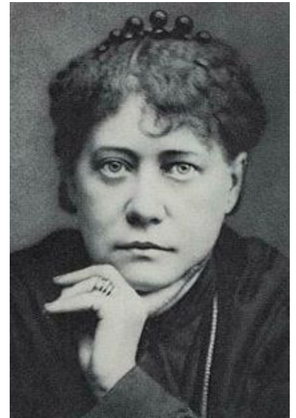
Madame Blavatsky (1831-91)