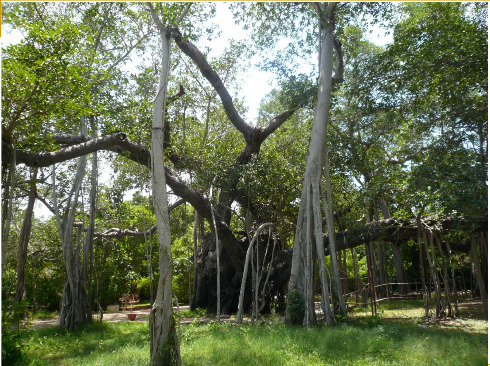
Banyan Tree, Adayar, Madras