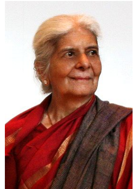
Radha Burnier, 2007

1875-1907 Colonel Olcott 1832-1907 1907-1933 Annie Besant 1847-1933 1933-1945 George S. Arundale 1878-1945 1946-1953 C. Jinarajadasa 1875 -1953 1953-1973 Nilakanta Sri Ram 1889-1973 1973-1979 John B S Coats 1906-79 1980- Radha Burnier 1923-