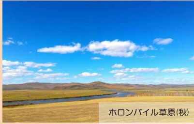
ホロンバイル草原(秋)