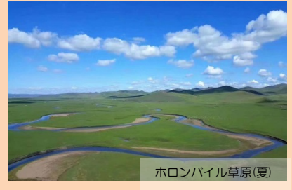
ホロンバイル草原(夏)