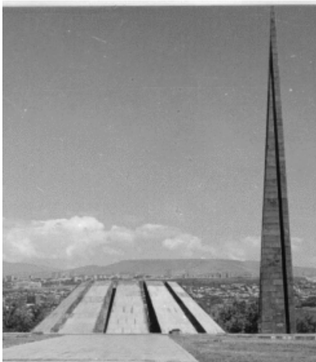
Мемориал жертвам геноцида 1915 года, Ереван.

вала, что мертвые возвращаются в Армению, тогда как живые ее покидают, имея в виду ряд торжественных церемоний перезахоронения в конце 1990-х гг. – нечто вроде «репатриации» в Армению известных армянских покойных деятелей из диаспоры, с одной стороны, и одновременную массовую эмиграцию из Армении, с другой стороны. 48