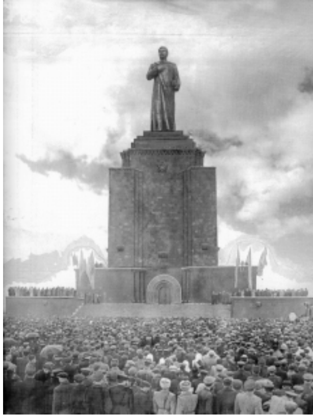
Открытие монумента Сталина в Ереване, 1950.

Естественно, что главными врагами «памятничко-борцев» стали великие «предки» советского режима. Памятники Сталина, главного тирана, были уже удалены после его смерти. В Ереване такой памятник, один из самых гигантских в обширной семье памятников Сталина, предмет гордости армян в период сталинизма, был демонтирован за одну ночь в начале 1960-х годов – смерть медного двойника тирана, как и жизнь прототипа, была окружена тайной. Демонтаж, который проводила армия, стоил жизни одному солдату – возможно, последней жертве кровавого режима. Тем не менее даже после «смерти» памятник Сталина продолжал оставаться опасным. Так, бывалые капитаны, направлявшие суда вдоль по реке Енисею, по слухам, меняли курс, чтобы не проходить над тем местом, где в 1961 году была утоплена белая мраморная статуя Сталина. Статуя некогда стояла в специальном пантеоне, посвященном годам ссылки, которые Сталин провел в этих краях до Революции. 10