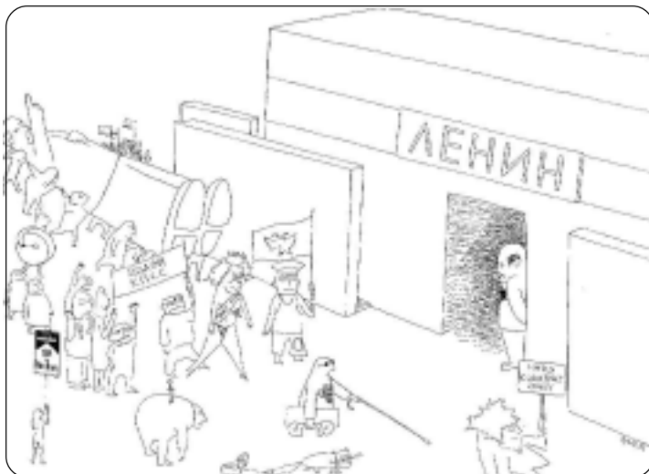
Карикатура автора, отражающая бурные процессы переоценки ценностей в период распада СССР.

также с памятниками – их разрушением-созиданием. Как мы увидим в статье, постсоветское отношение к памятникам во многом близко революционной культуре 1. Значит ли это, что мы в преддверии новой тоталитарной культуры 2? (В. Паперный усматривал цикличность двух культур.) Или подходит эра новой многослойной постсоветской