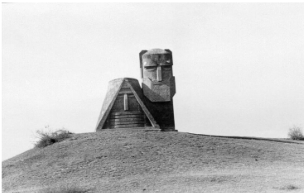
Памятник «Мы и наши горы» в Нагорном Карабахе.