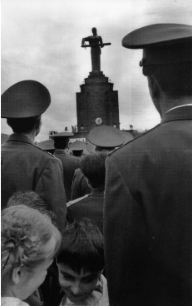
Мать-Армения, сменившая Сталина в 1967 г. (Фотография взята из книги «Мой Ереван. Մոյ Երեւան. Му Երեւան. Автор и составитель – Г. Закоян. Ереван: АКНАЛИС, 2002. – С любезного разрешения автора и издательства.)

характерны памятники в виде стел (развитие «культурного» варианта упомянутой выше модели предпамятников), среди которых жанр хачкара стал даже национально специфичным. Образ же Матери-Армении вообще, скорее всего, был заимствован из русской традиции, причем позднего времени – ср. плакат «Родина-мать зовёт» первых военных лет и гигантский послевоенный мемориал в Волгограде (Сталинграде). Может быть, это и стало причиной того, что памятник Матери-Армении так и не стал новым символом армянской идентичности 35 – эту функцию главным образом выполняет большой памятник герою армянского эпоса Давиду Сасунскому работы Ерванда Кочара, стоящий на вокзальной площади города.